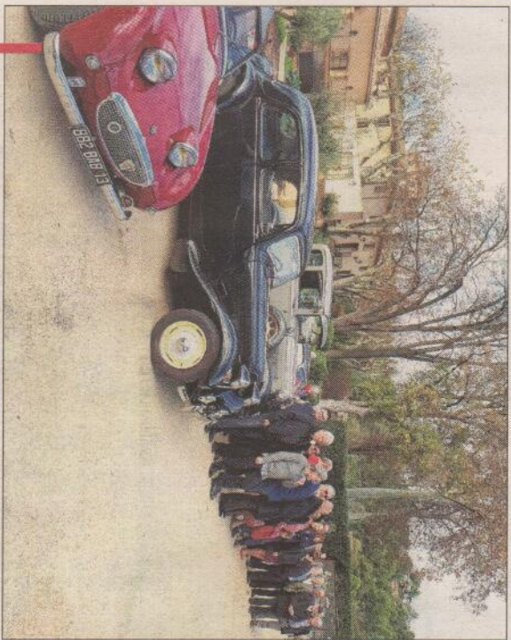
Les véhicules datent de 1907 au début des années 80 et font tourner les têtes sur leur passage.